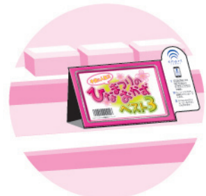
売り場の棚に貼って消費者へアピール