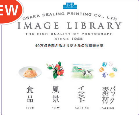
IMAGE LIBRARY オリジナル写真素材集

ストック数が40万点を超えるOSPオリジナルの写真素材集がリニューアルしました。すべての印刷物に自由にご利用いただけます。