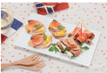
炙りサーモンのオードブル