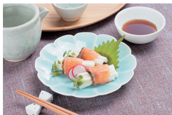
炙りサーモンの大根・かいわれ巻き