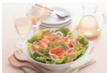
炙りサーモンのサラダ