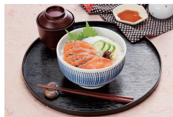
炙りサーモンと烏賊の海鮮丼