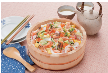
炙りサーモンのちらし寿司