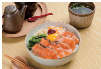
炙りサーモンの丼・ビビンバ風