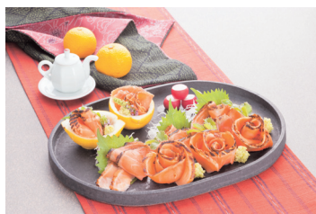
炙りサーモンの刺身