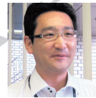
北日本営業所(盛岡)