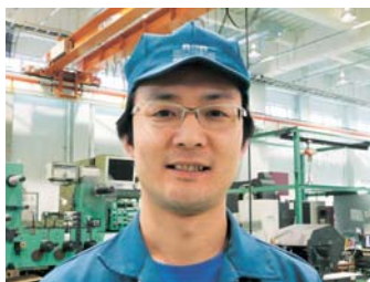
メンテナンス担当 東主査

まずは使う人の安全を第一に考え、 生産性の向上、品質の安定を目指し、 メンテナンスに取り組んでいます。