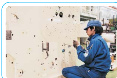
安全性の向上を目指し、しっかりとした 保守点検が行われます