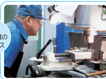
技術と経験をいかした工作作業