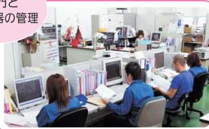
機器設計のエキスパートが対応します