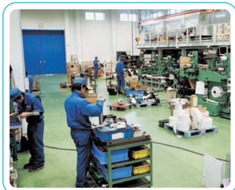
様々な印刷機周辺装置が修理・調整 されています