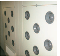
入り口に設けたエアシャワー