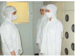
クリーンルーム(機械導入前)