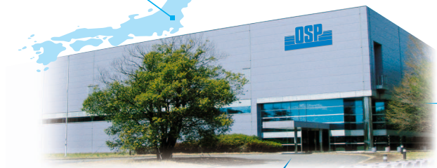
新たに建設された那須第二工場