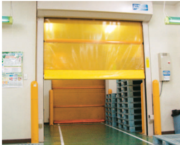
現場内に配備された2重シャッター