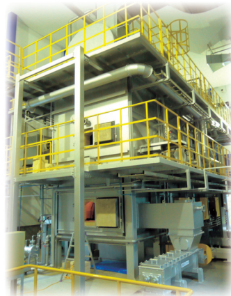
滋賀第二工場のバイオマスボイラー