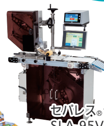
セパレス®ラベラー上下貼機 SLA-95V/SLA-98MX