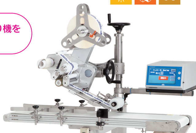
スタンダードラベラー自動上貼り機