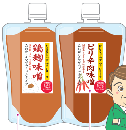
規格品のスタンド袋